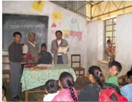
Verleihung einer Dankesurkunde

Die beiden sind sozial engagiert bei „Effort Nepal“, einer Organisation, die sich um Schulbildung in den Bergdörfern des Himalajas bemüht. W.M.