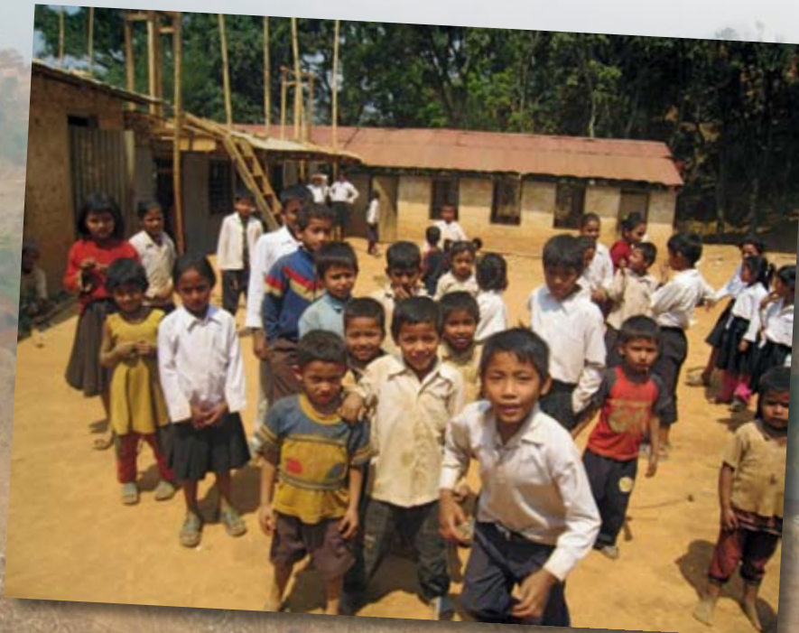
Dorf in der kargen Bergwelt des Himalaya