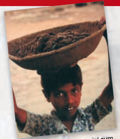
Kuhfladen als Heizmaterial zum Kochen einsammeln, statt Fußball zu spielen