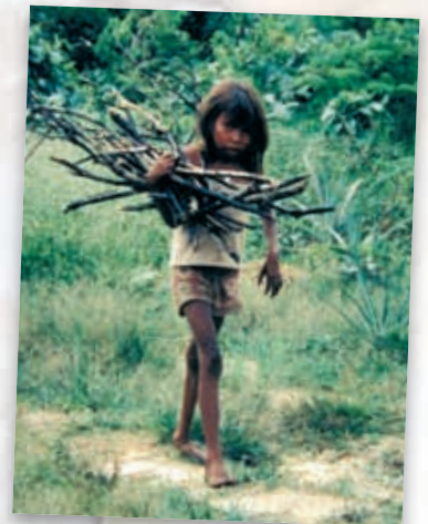
Das Mädchen ginge lieber zur Schule

Bitte Überweisung mit dem Stichwort „Kinderarbeiter“