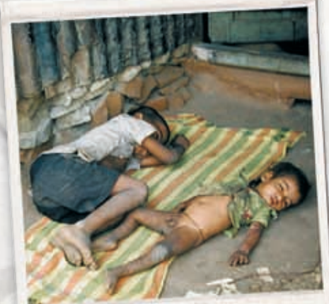
... wenn es SO beginnt?