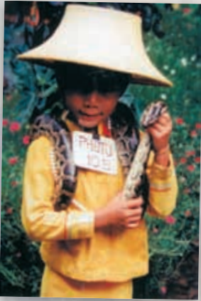
... sich für umgerechnet 25 Cent fotografieren lassen, statt zu spielen