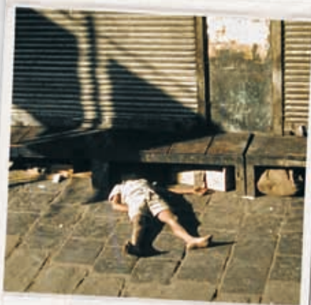
... dieser Kinder weitergehen,...