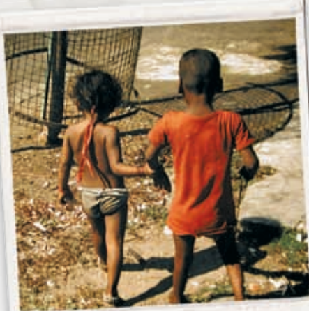
Wie wird das Leben...