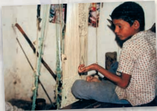
Webarbeiten in fast fensterlosen Räumen für einen „Hungerlohn“

Jeder noch so kleine Betrag trägt dazu bei, dass ein Kind weniger ausgebeutet wird!