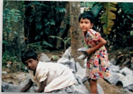
Je mehr Kinder helfen, desto mehr Einnahmen: Tageslohn: 1-2 Euro