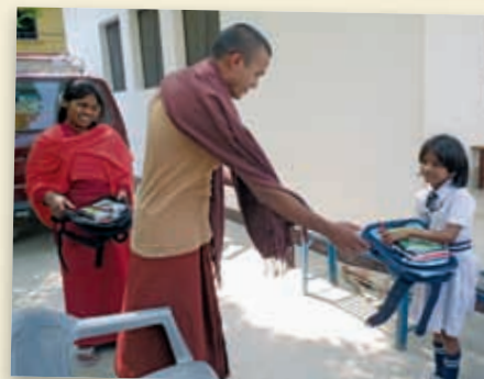
Wer übernimmt die Schulkosten für diese Mädchen in Nepal? Proj.-Nr.: 516